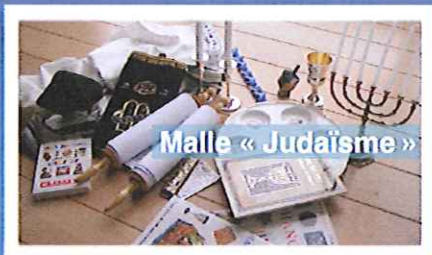
Malle « Judaïsme »