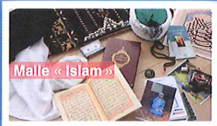
Malle « Islam »