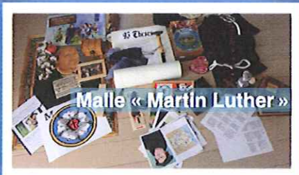
Malle « Martin Luther »

Ces trois malles, facilement transportables, compilant des outils pédagogiques et documentaires peuvent être empruntées au Secrétariat de l'Enseignement religieux protestant.